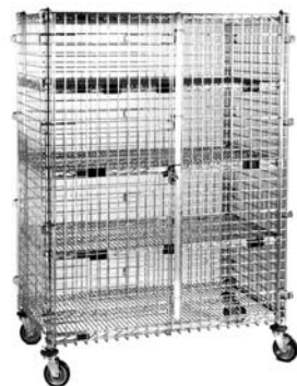
Unidad de seguridad móvil de tamaño grande con estantes centrales opcionales