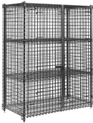
Unidad de seguridad estacionaria de tamaño grande con estantes centrales opcionales

Unidad de seguridad estacionaria Eagle pequeña, modelo _____. Acabado cromado construida con alambre desnudo y con estantes de diseño patentado Quad-Truss®. Puertas dobles que permiten un acceso completo y trabas de acción rápida con pestillo para candado. Altura total de 40".