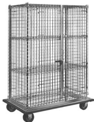
modelo de tamaño grande con plataforma móvil y estantes centrales opcionales